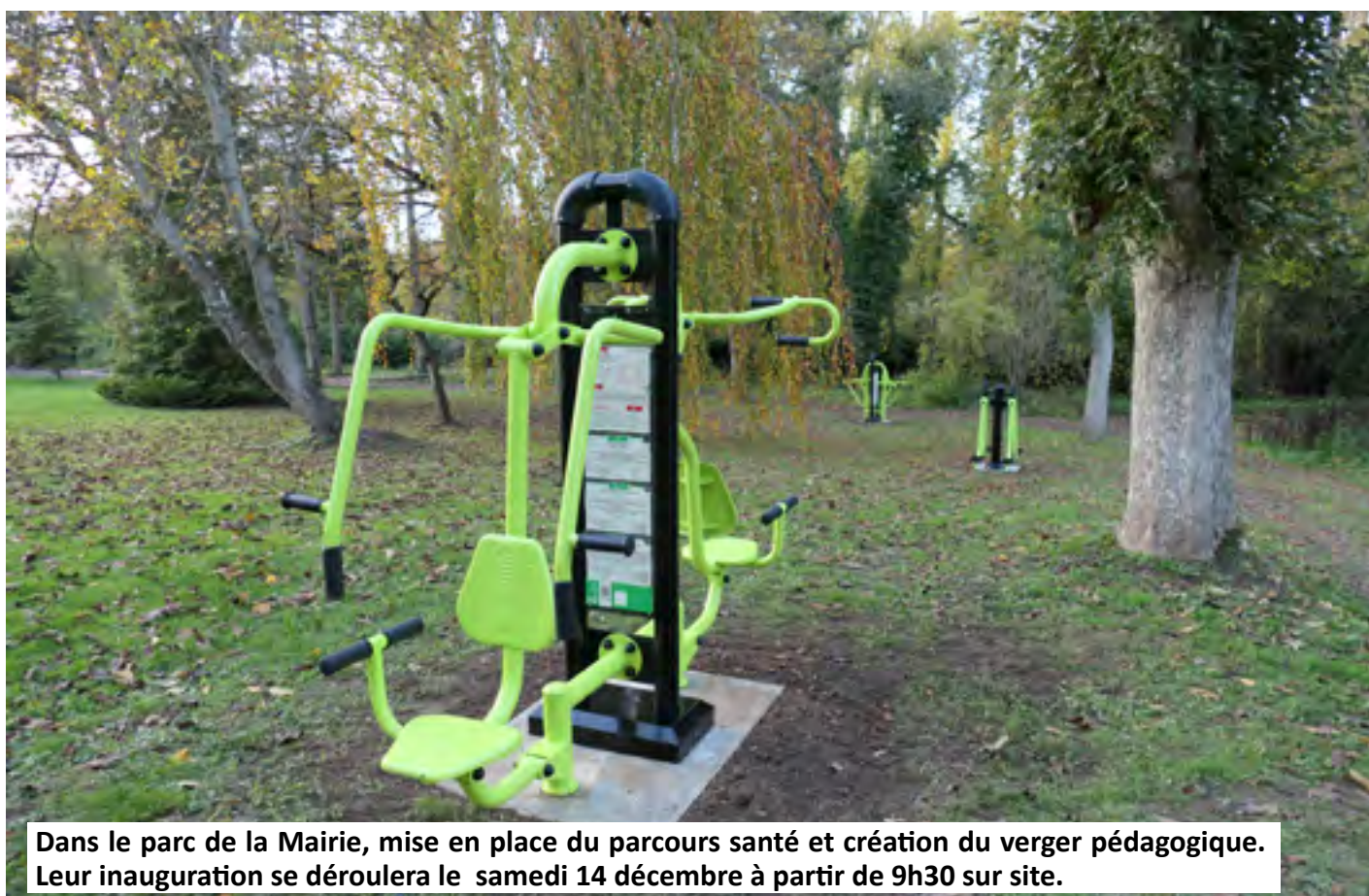
Dans le parc de la Mairie, mise en place du parcours santé et création du verger pédagogique. Leur inauguration se déroulera le samedi 14 décembre à partir de 9h30 sur site.