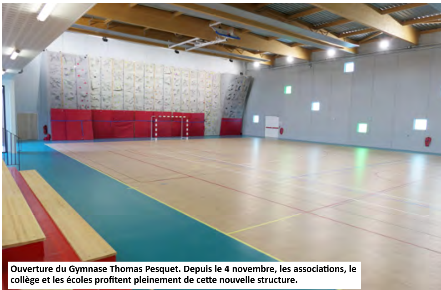
Ouverture du Gymnase Thomas Pesquet. Depuis le 4 novembre, les associations, le collège et les écoles profitent pleinement de cette nouvelle structure.