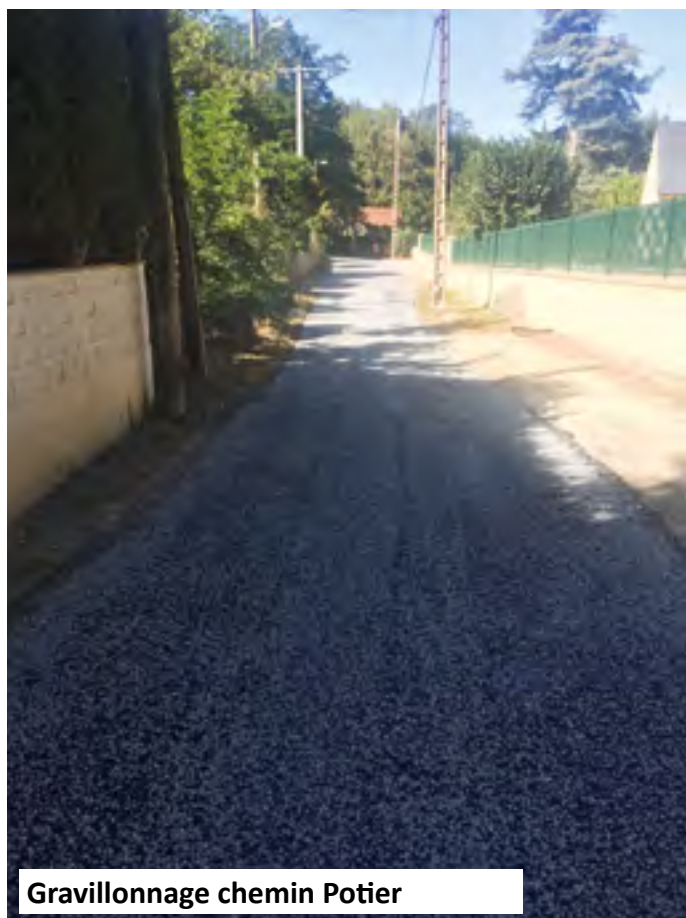
Gravillonnage chemin Potier