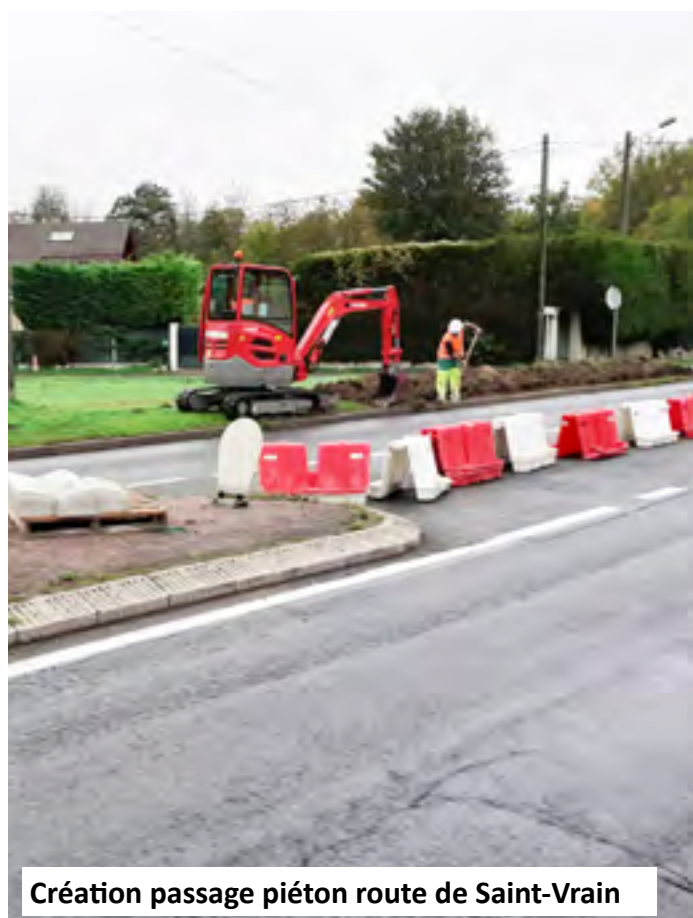
Création passage piéton route de Saint-Vrain