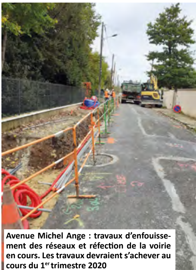
Avenue Michel Ange : travaux d'enfouissement des réseaux et réfection de la voirie en cours. Les travaux devraient s'achever au cours du 1 er trimestre 2020