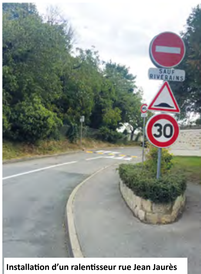
Installation d'un ralentisseur rue Jean Jaurès